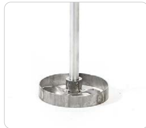
CX MIX03 MANUALE ANCHE CON MOTORE MAGGIORATO