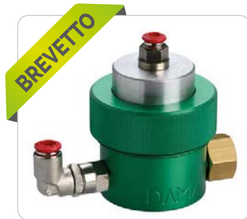
nuovo modello brevettato