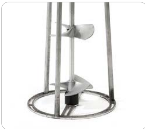
CX MIX02 PER FUSTI