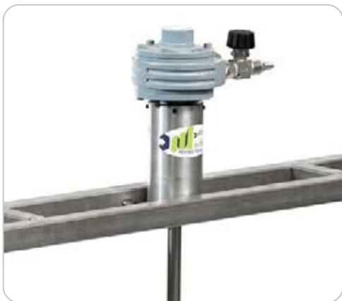
CX MIX01 PER CISTERNE